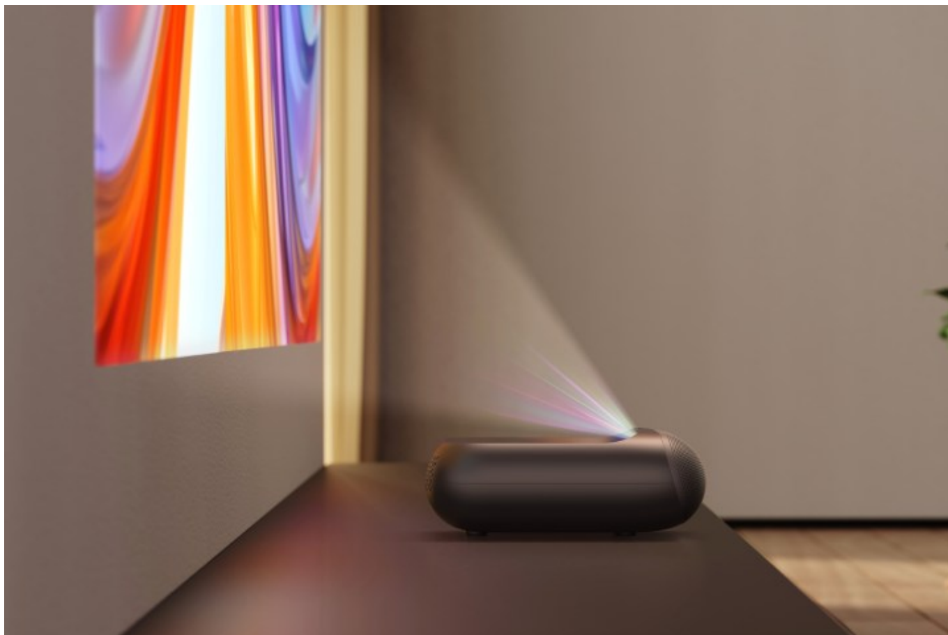
O projetor UST Yaber K300sYaber

O Yaber K300s marca a primeira incursão da empresa no atraente mercado de projetores UST, à medida que os consumidores de entretenimento doméstico procuram maneiras acessíveis e de alta qualidade de trazer a visualização em tela grande para suas casas sem ter que reorganizar seus móveis para isso. Ao contrário dos projetores padrão que podem ocupar desajeitadamente uma sala de estar valiosa, os projetores espaciais UST podem projetar uma imagem enorme em sua parede ou tela a apenas alguns centímetros de distância, permitindo que os usuários os coloquem frequentemente em unidades de mídia existentes.