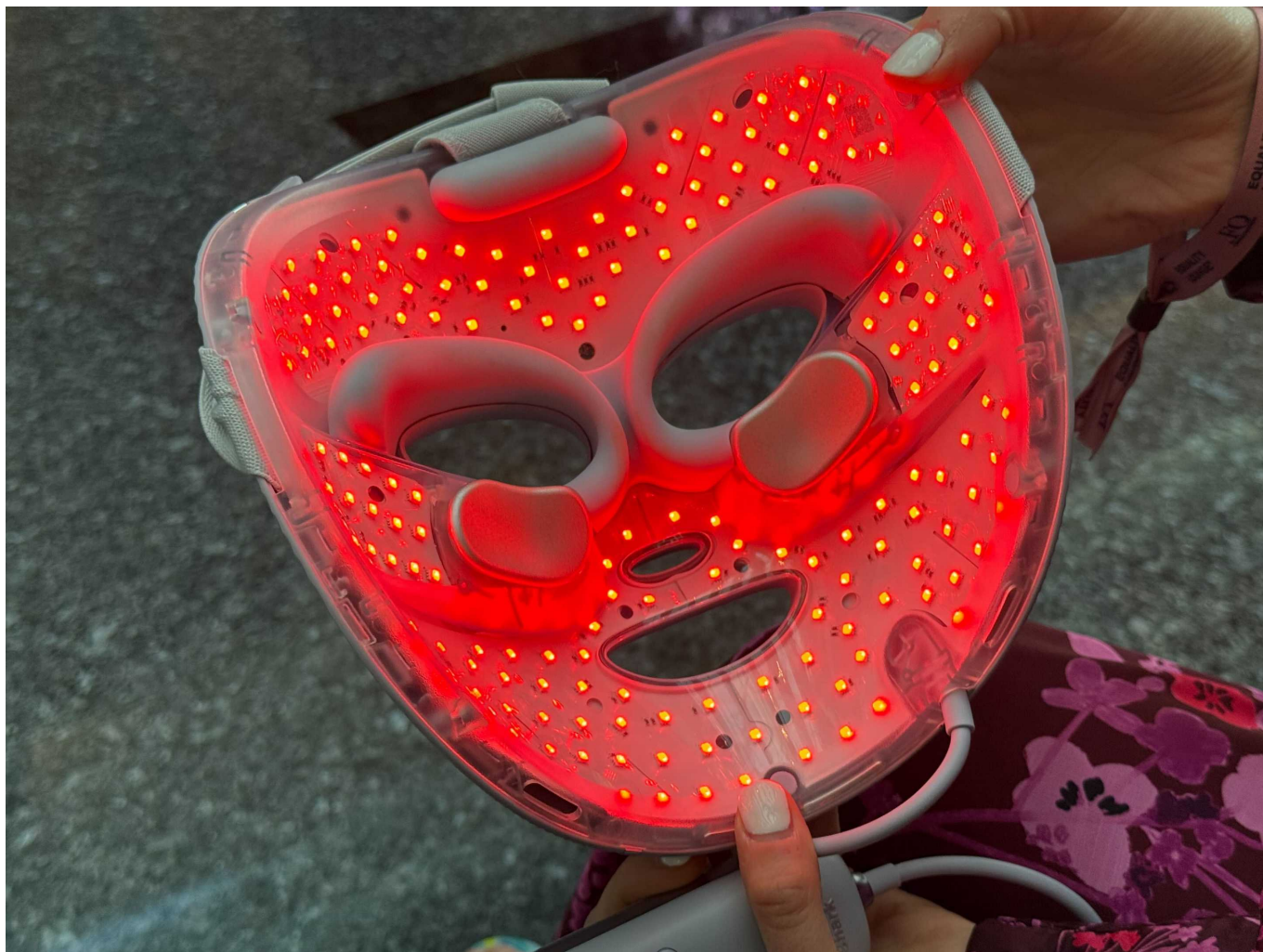
Cherlynn Low para Engadget

É esse tipo de matemática que Lessing destacou com entusiasmo em nossa rápida reunião, ao me dizer que a empresa trabalhou duro para calcular a combinação ideal de fatores como a distância das lâmpadas ao rosto do usuário e umas das outras. Para isso, o CryoGlow ficará posicionado de forma que os LEDs fiquem a cerca de 15 mm da sua pele - um bom equilíbrio entre eficácia e cobertura. As próprias lâmpadas estão espaçadas de 10 mm, e os quatro programas que o Shark oferece também consideram a duração das luzes em seu rosto.