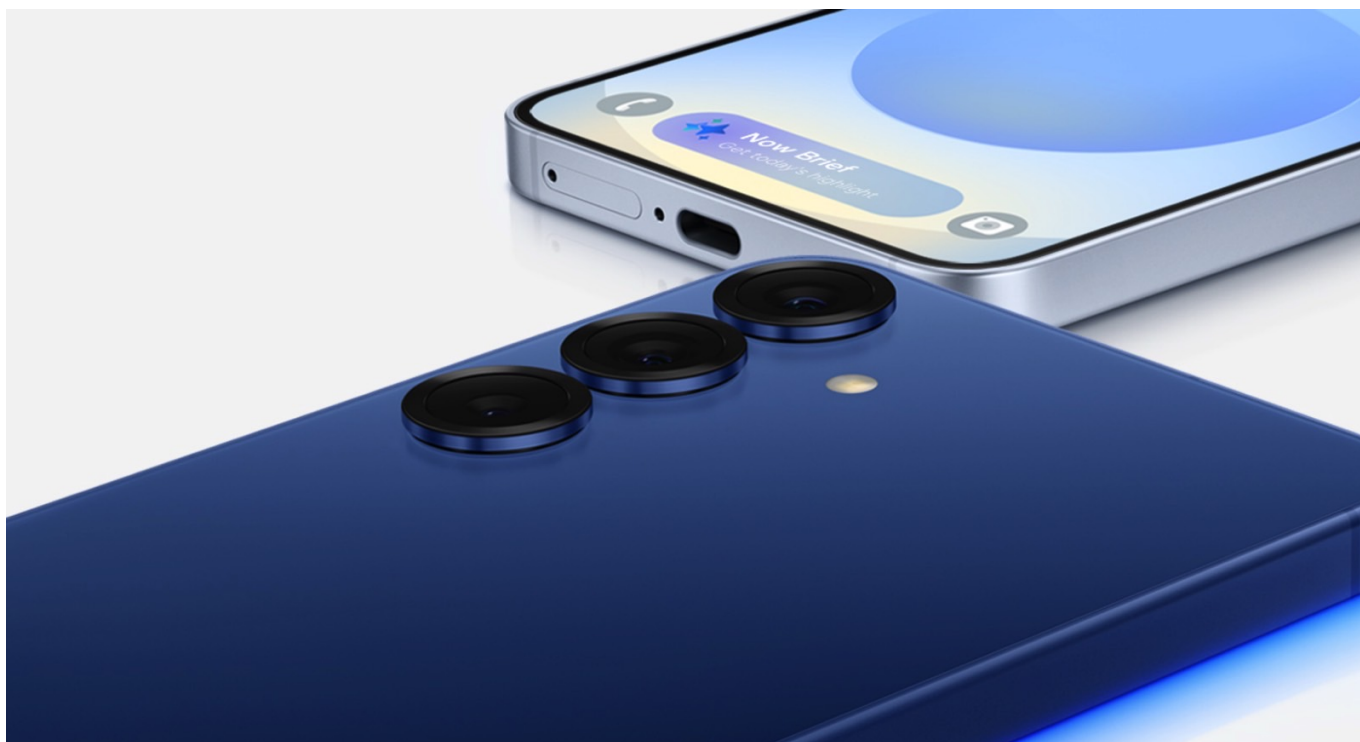
Design do Galaxy S25 e S25 Plus.

O Galaxy S25 Ultra oferece a melhoria mais notável dos três. O telefone possui bordas curvas, o que considero uma atualização importante. O enorme telefone será mais fácil de manusear agora que não possui cantos afiados.