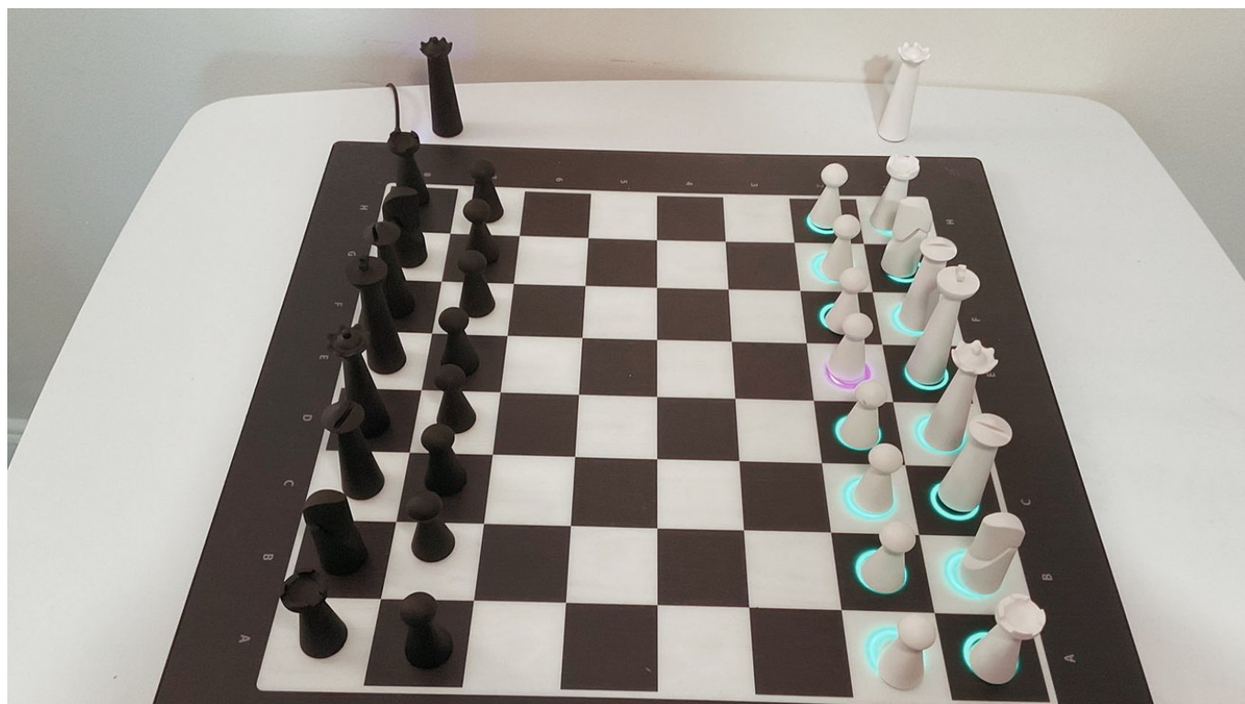
GoChess Lite - sugestão de IA mostrando um movimento de abertura preferível

Você só precisa carregar sua placa GoChess - que, aliás, carrega via USB-C - e inicializar o aplicativo.