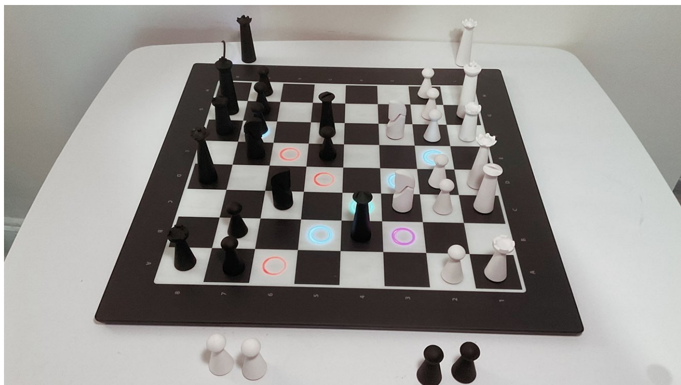
GoChess Lite - Alertas de erros impedem que você cometa erros facilmente evitáveis

O próximo recurso é o alerta de erro. Se você é novo no xadrez, é fácil cometer acidentalmente um movimento errado nos estágios iniciais ou intermediários de um jogo, o que pode ser excepcionalmente difícil de recuperar. Alertas de erro irão destacar movimentos “ruins” em vermelho, o que ajuda você a reconhecer como é um movimento ruim sem ter que fazê-lo.