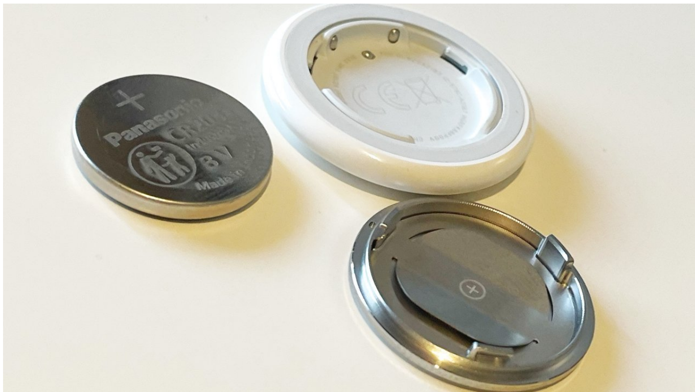
Uma tag desmontada

Não está fora dos limites da expectativa para a Apple trazer à tona uma versão que se encaixa em uma carteira sem uma protuberância reveladora. Mas, como terceiros já os estão fazendo, a Apple pode optar por manter um design que conhece bem, em vez de se ramificar.